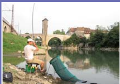
▲ Pêcheur de poissons blancs à Orthez

*Ainsi que les canaux dérivant des cours d'eau