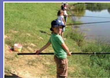
▲ Ecole de pêche à Orthez