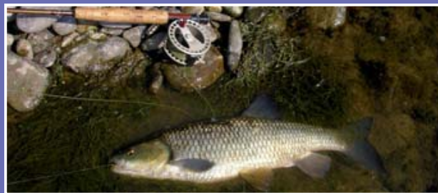
▲ Chevesne à la mouche