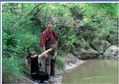
▲ Découverte de la pêche sur la Baïse

* Ainsi que les canaux dérivant des cours d'eau