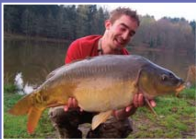
▲ Une jolie carpe

En 2 e catégorie : pêche de la truite arc-en-ciel autorisée uniquement durant la période d'ouverture de la 1 ère catégorie.