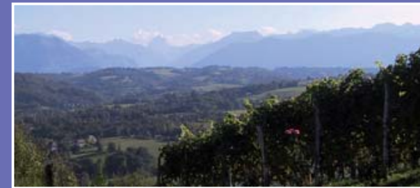
▲ Les vignobles du Jurançon