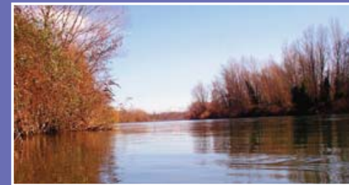
▲ Le gave de Pau en aval