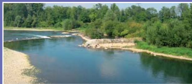
▲ Le Gave de Pau