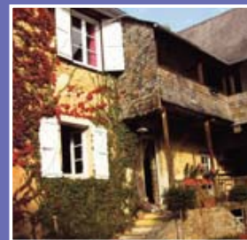
▲ Ferme béarnaise