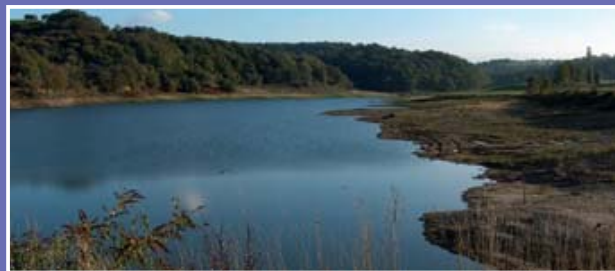
▲ Lac de Viellesegure