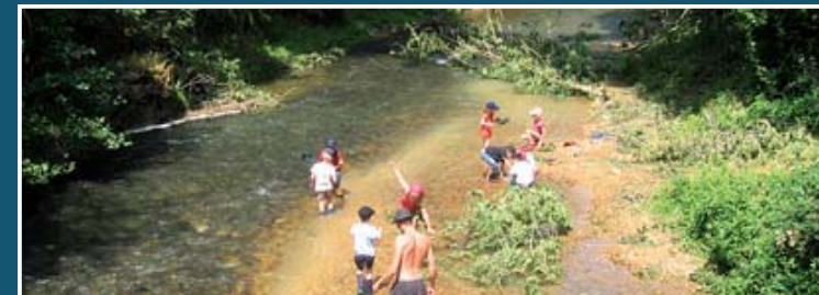
▲ Découverte des milieux aquatiques du Gabas