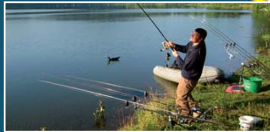
▲ Pêche à la carpe sur le lac de Corbère