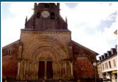
▲ Eglise de Morlaàs

Réserves particulières : Dignes des retenues de CORBÈRE, de BASSILLON, de CADILLON et de CASTILLON ♦ Ruisseau le GABASSOT et lac de GARLIN depuis 50 m en amont du pont du chemin de ronde du lac, enjambant le GABASSOT, jusqu'à 50 m en aval.