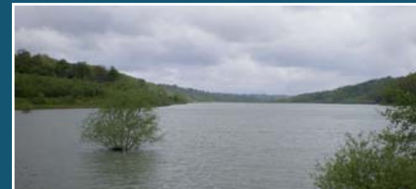
▲ Lac du Balaing