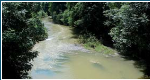
▲ les méandres de Luy-de-France