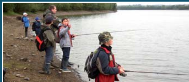
▲ Découverte de la pêche sur le lac de Mazerolles