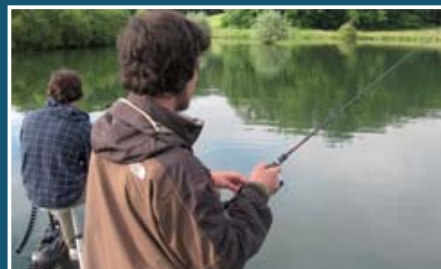
▲ Pêche aux leurres