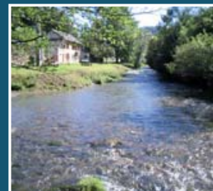
▲ Le Luy de France