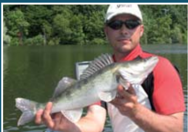
▲ La prise d'un beau sandre

* Ainsi que les canaux dérivant des cours d'eau