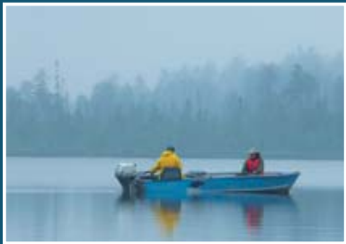
▲ Pêche en barque