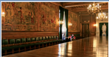
▲ Château de Pau - Salle aux cent couverts