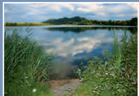
▲ Réservoir de pêche Iktus