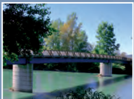
▲ Le gave de Pau