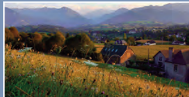
▲ Le village d'Asson