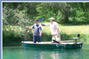
▲ Pêche aux leurres à Iktus