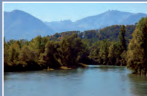
▲ Le gave de Pau à Baudreix