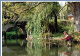
▲ Le Béz

* Ainsi que les canaux dérivant des cours d'eau