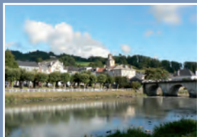
▲ Le gave à Nay

* Ainsi que les canaux dérivant des cours d'eau